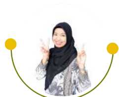
Eka Wahyanti @ewahyanti